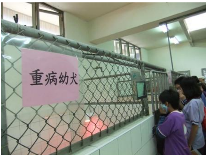
師生在收容所隔離區內觀察重病犬隻，後續並針對觀察項目，與動物衛生檢驗所林課長討論流浪狗的成因、政府政策、收容所的動物福利問題。