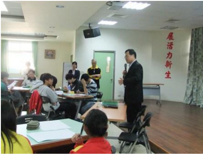
鼎金國中校長說明座談目的、及校園公民參與的精神。