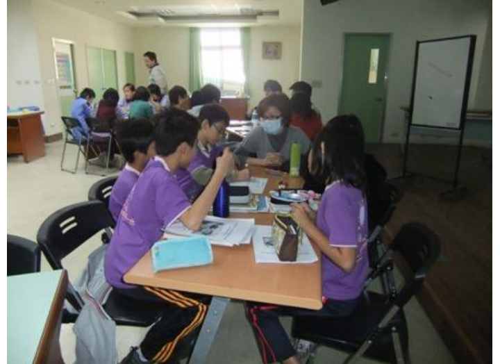
分組討論各項動物倫理爭議、觀看影片心得等。