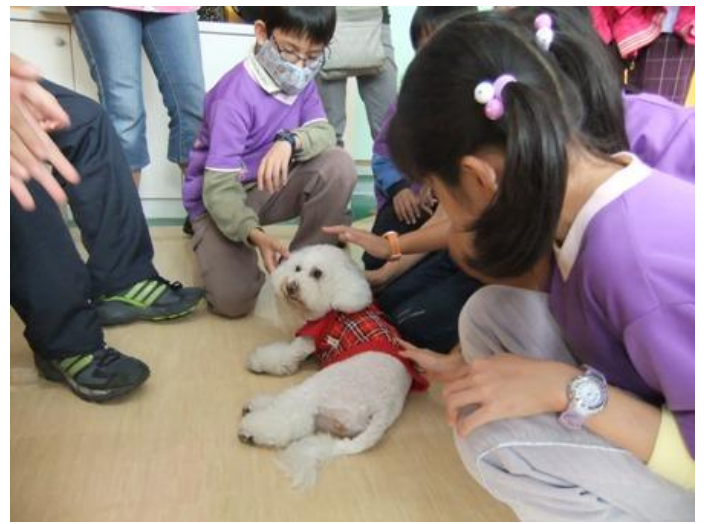
學生與動物行為課程的小助教（比熊犬）互動。