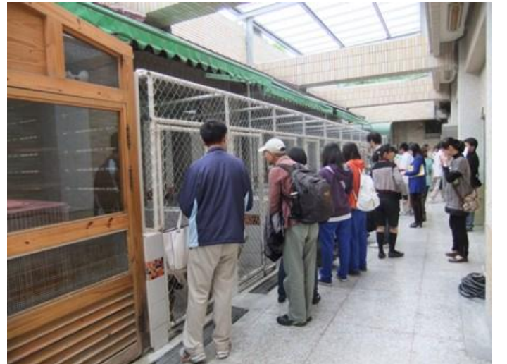
師生參觀高雄市立動物收容所，思考從寵物犬到流浪犬的過程因由，以及群體飼養的動物福利、安樂死等問題。