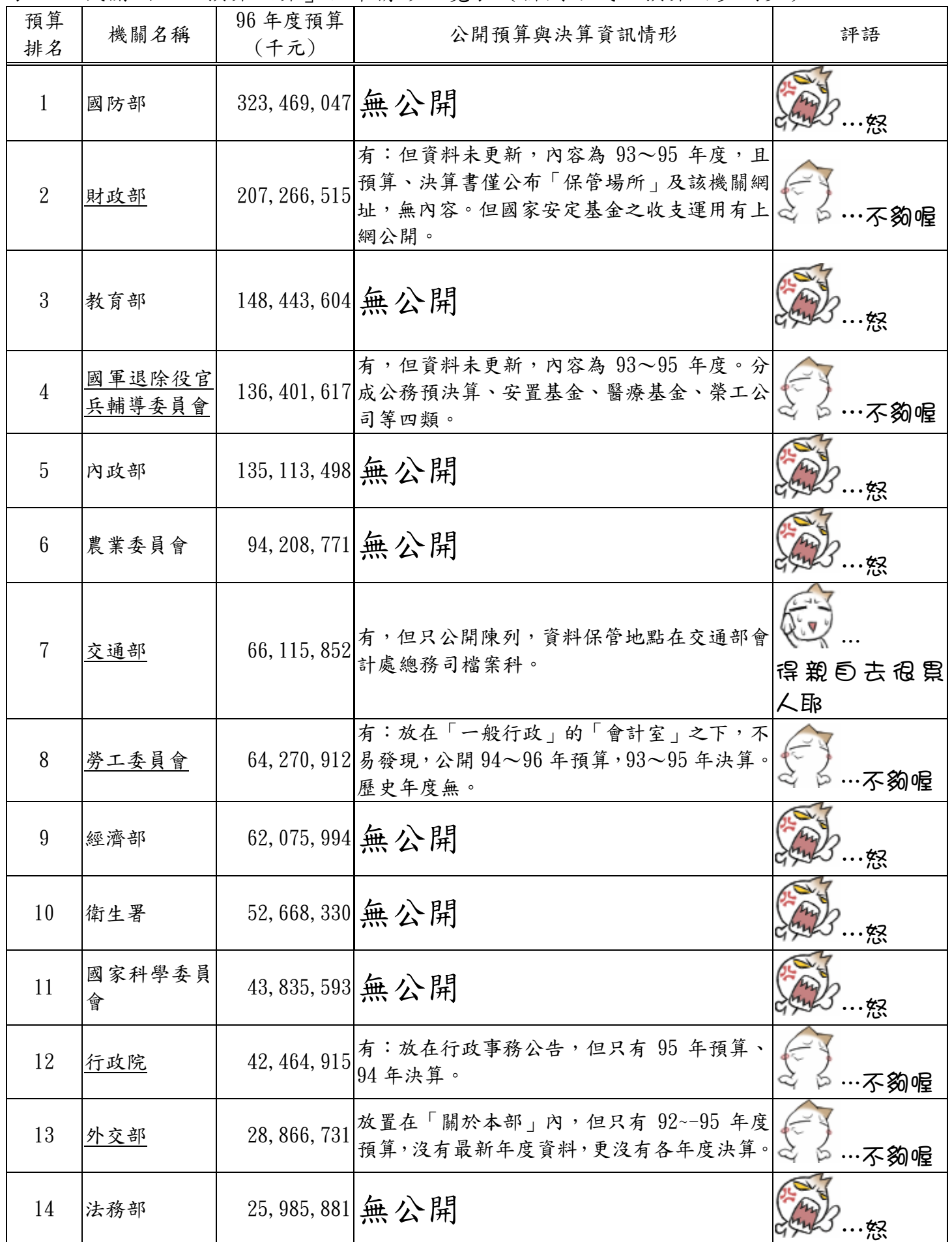
表六：機關網站「預算決算」公布情形一覽表（排列方式：預算由多到少）