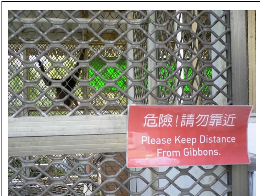
照片一：長臂猿的飼養環境、空間、甚至是標語，都與張大千先生愛護猿猴的本意違背。