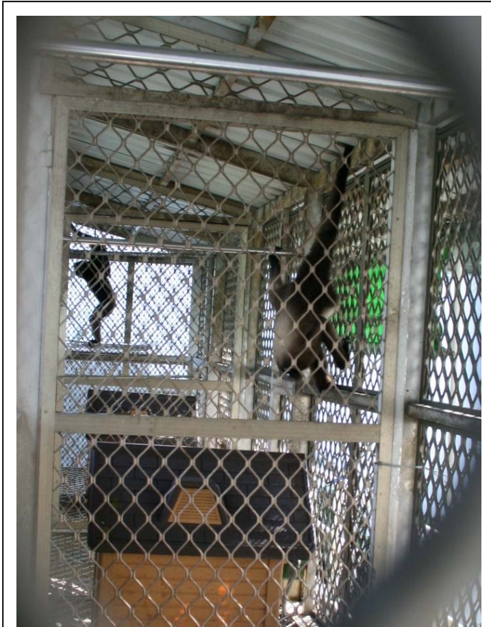
照片三：鋁製籠內未提供任何樹木，僅有一根金屬鐵棍供其擺盪，還放了裝飾性高於實用性的「小狗屋」。