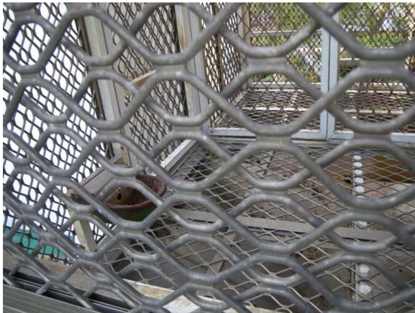
照片二：菱型網架不利長臂猿腳掌踩踏。