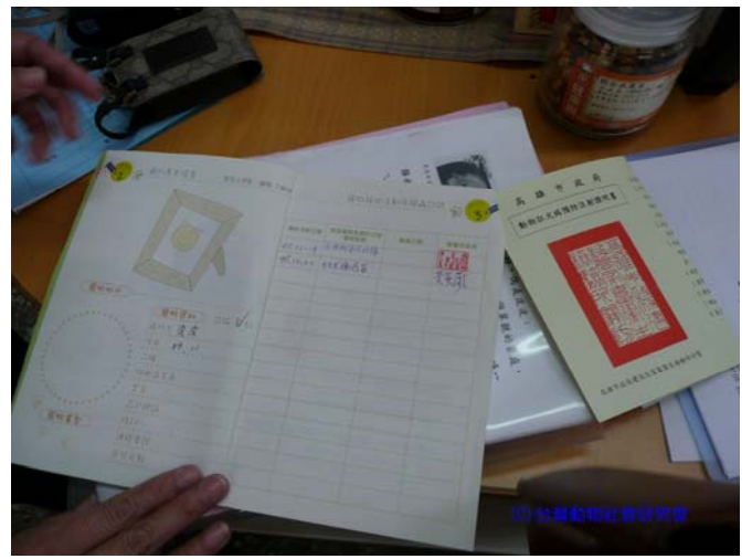
(98/3/19 鼎金國中：輔導室主任負責皮皮每年的預防注射紀錄、驅蟲、洗澡，以確保校犬健康)