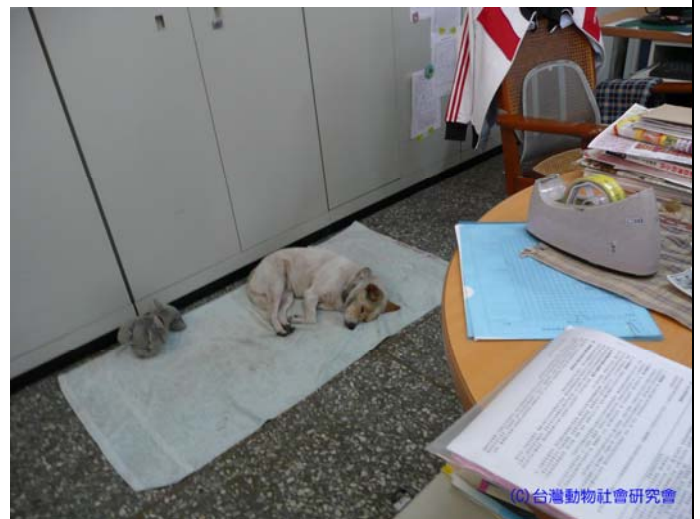
(98/3/19 鼎金國中：輔導室一角，是校犬皮皮日間的休憩區，師生隨時能在輔導室與校犬互動)