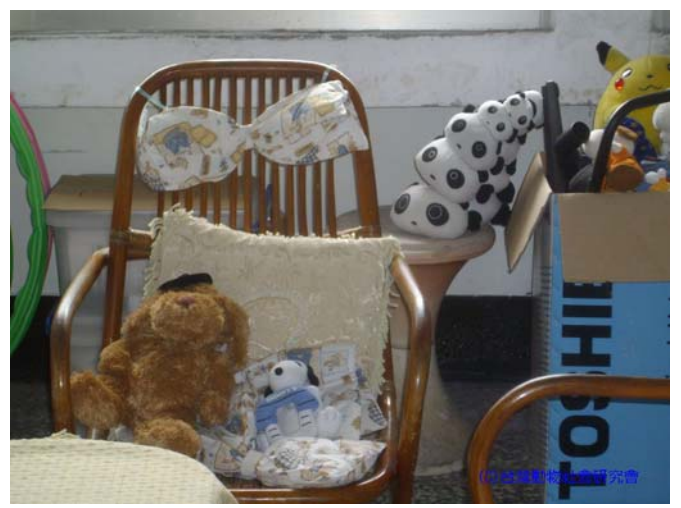
(98/4/7 五福國中：座位上有許多布偶，輔導主任表示，要讓學生有東西可以「擁抱」，擁抱能提供溫暖的情緒)