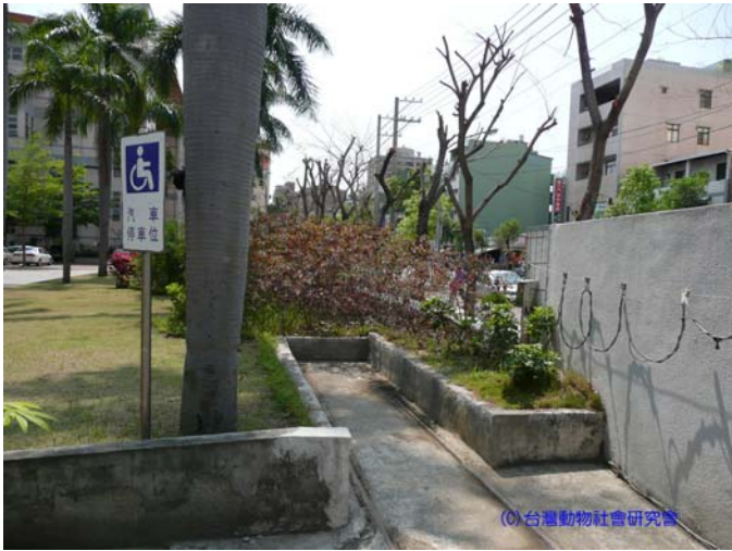
(98/3/19 鼎金國中：以樹木取代圍牆，開放式的學校環境，校園犬能有效驅趕其他外來犬)