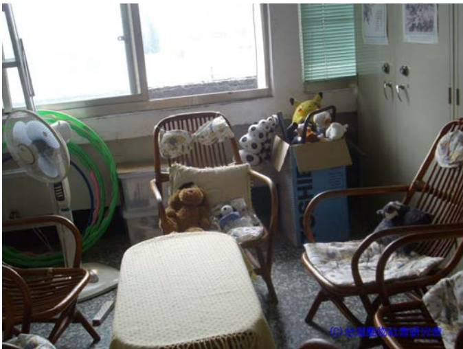
(98/4/7 五福國中：諮商室的大窗戶可看到陽光和校門口的飛舞鴿群，輔導主任表示此區的佈置是為了製造「放鬆」的氛圍)