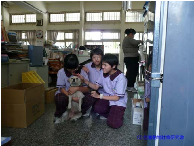
(98/3/19 鼎金國中：每節下課時間，會有學習障礙生主動來輔導室與皮皮擁抱、說話、餵食，輔導老師通常在旁讓他們自然互動，不刻意介入)