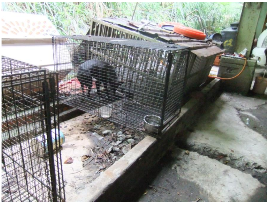
石碇留置所:幾個破狗籠擺在水溝上，沒有食物、飲水，任憑狗自生自滅。