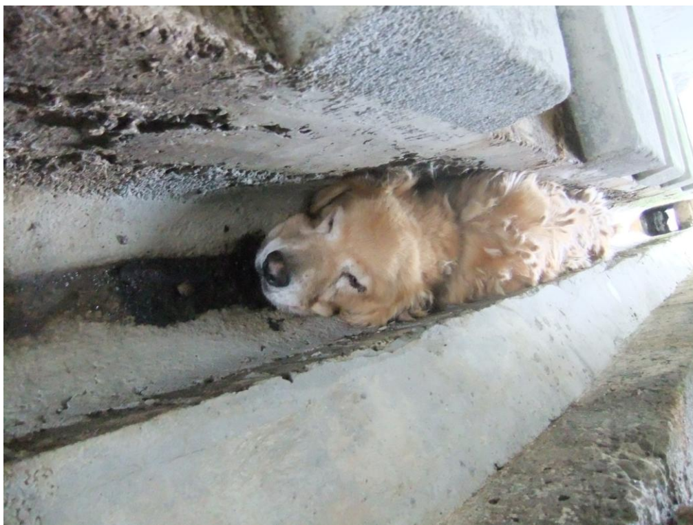
金山收容所，還獲縣府頒發獎金 30 萬。一隻狗卡在水溝裡死亡，竟無人聞問。