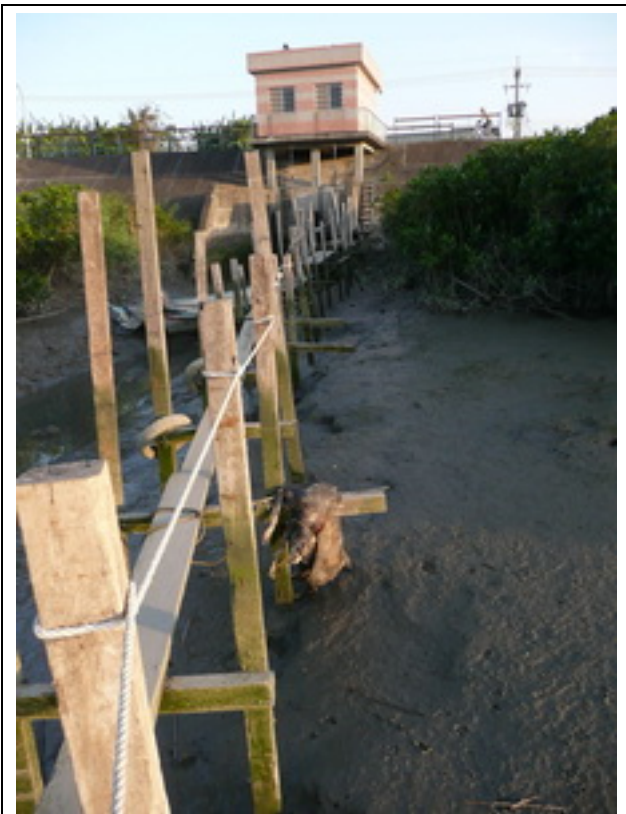
照片 9：從現場回看閘門。