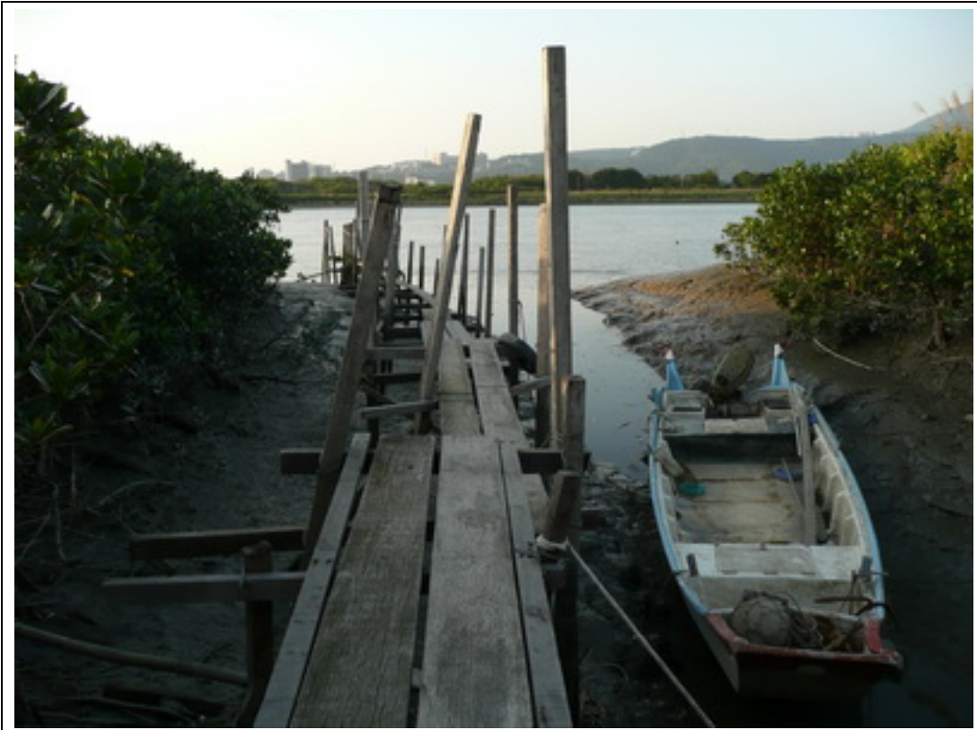
照片 8：棧道應為小艇進出方便而設。