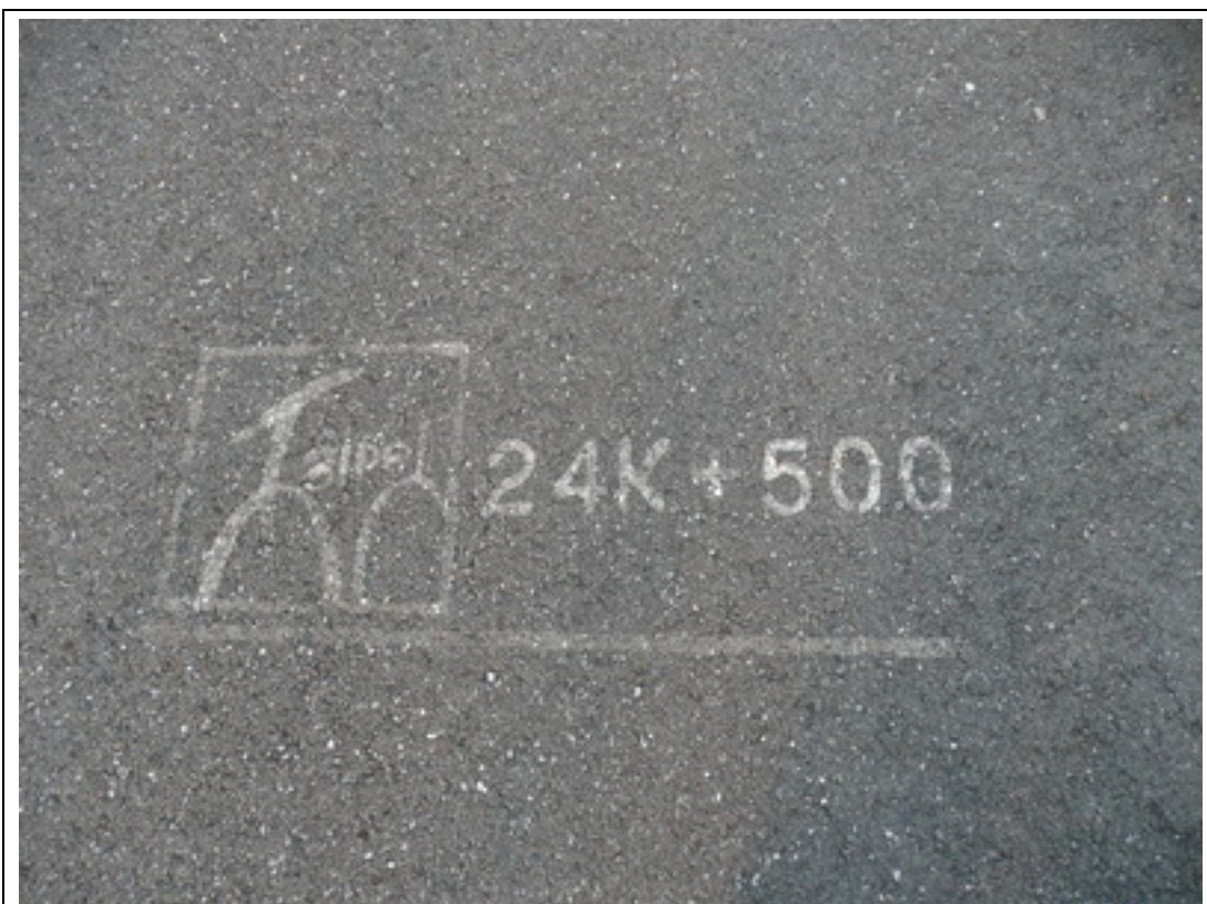
照片 3：再近一些，地上可見標示：24K+500。