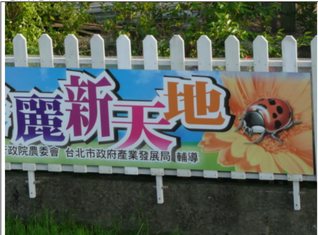
照片 1：現場附近有行政院農委會及產業發展局輔導的觀光園區。