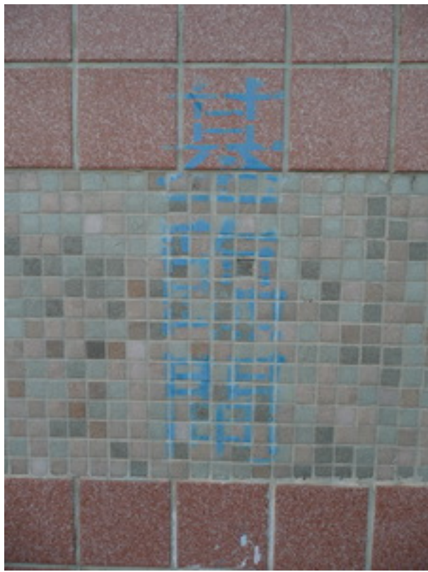
照片 5：現場就在這個「臨時閘門」的前方