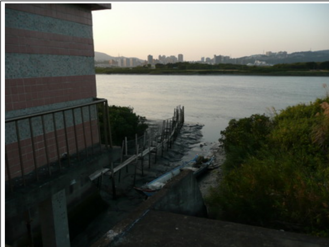
照片 7：閘門右方可遠眺關渡