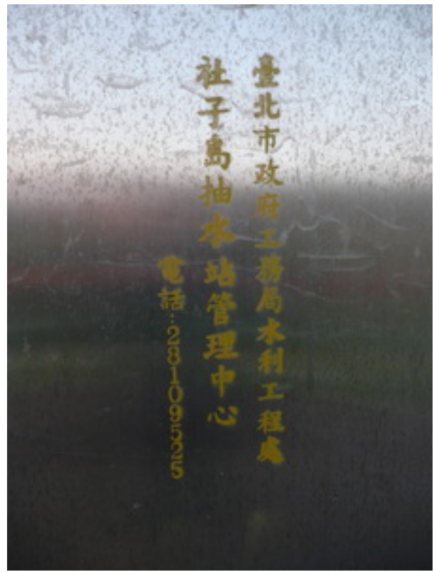
照片 6：這個閘門屬於市府工務局水利工程處「社子島抽水站管理中心」。