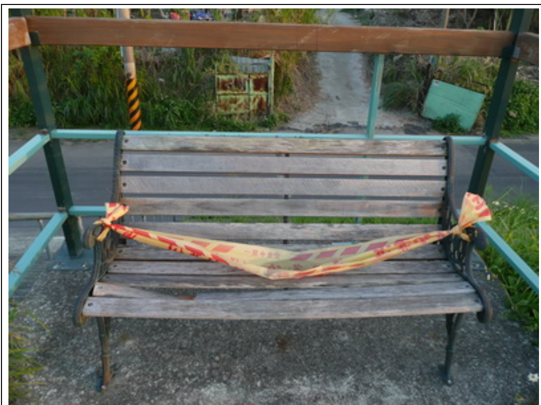
照片 4：再近一些，有一個已壞未修的座椅。